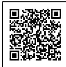
BELLAL HOSSAIN MONDAL